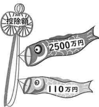
図2 相続財産に合算する相続時精算課税適用財産

相続財産に合算する相続時精算課税適用財産の価額は、原則として贈与時の価額とされています。